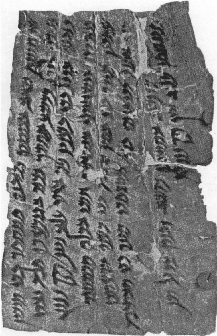
(1) Nivîsîna "Hewreman". (Cowley, A. (1919). The Pahlavi Document from Avroman. The Journal of the Royal Asiatic Society of Great Britain and Ireland , Cambridge, 149).

Piraniya gotinê xuyayî aramî ne (me ew di metnê de reş kirine), lê navê kesên hatine gotin -13 nav in- ew navin îranîya kevin in (me ew di metnê de meyl kirine), û ew ne deqa aramî bi tenê ye ku di qada îranî de hatiye vedîtin, ji dema berî vê deqê û di pişt re jî.